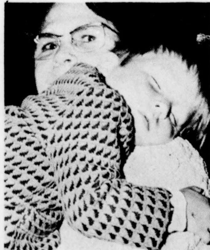
BEBE DORT PENDANT QUE maman surveille les valeureux nageurs à l'oeuvre.